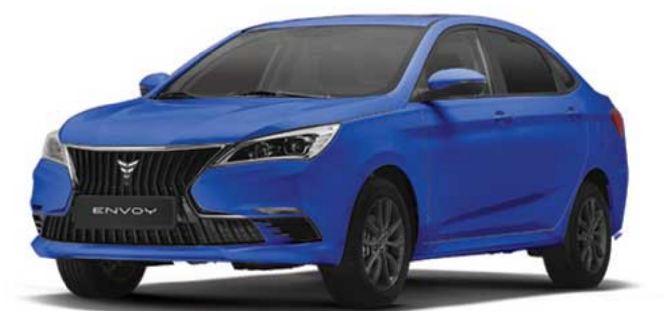
آبی اطلسی Atlantic Blue