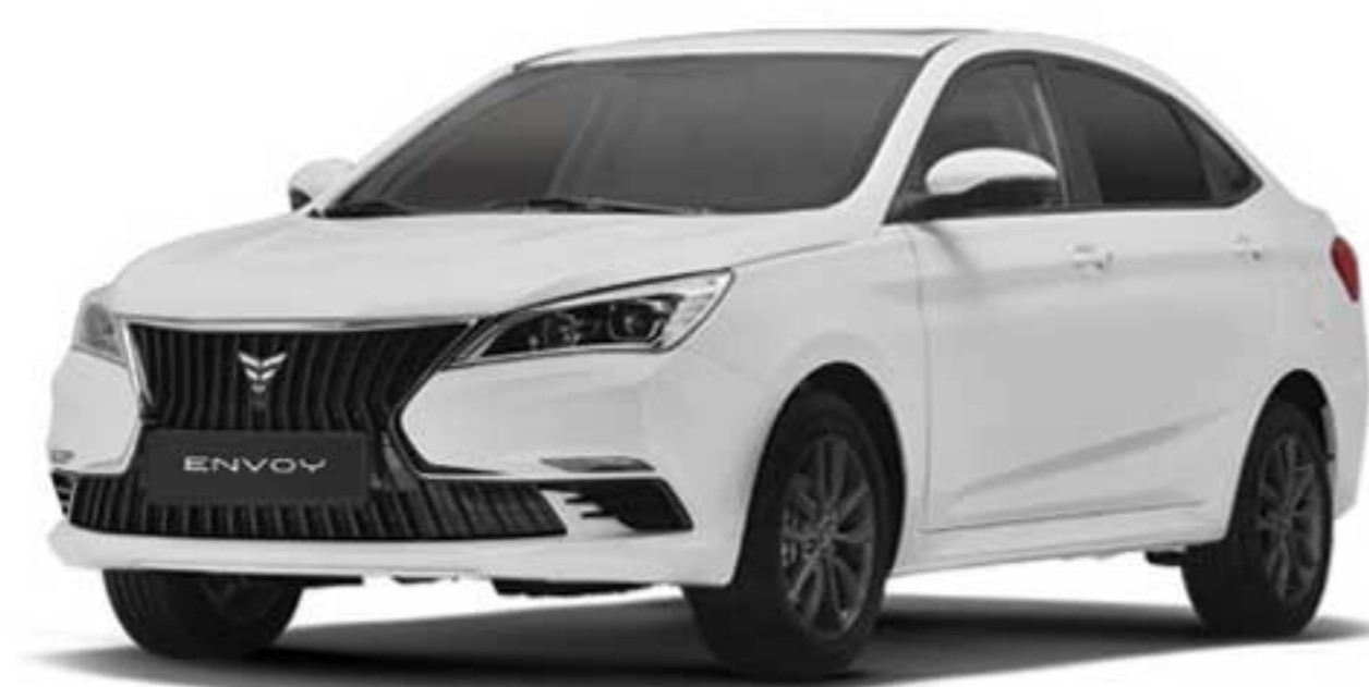
سفید روغنی White