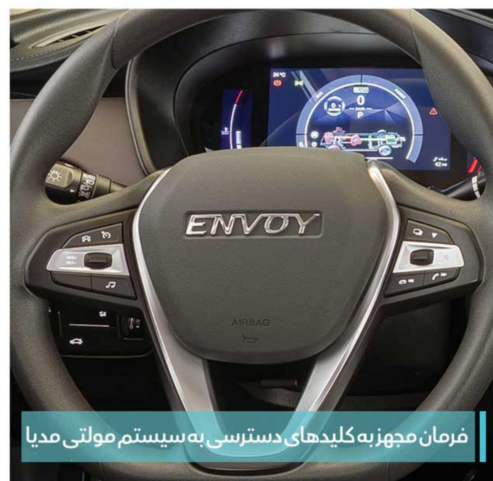
فرمان مجهز به کلیدهای دسترسی به سیستم مولتی مدیا