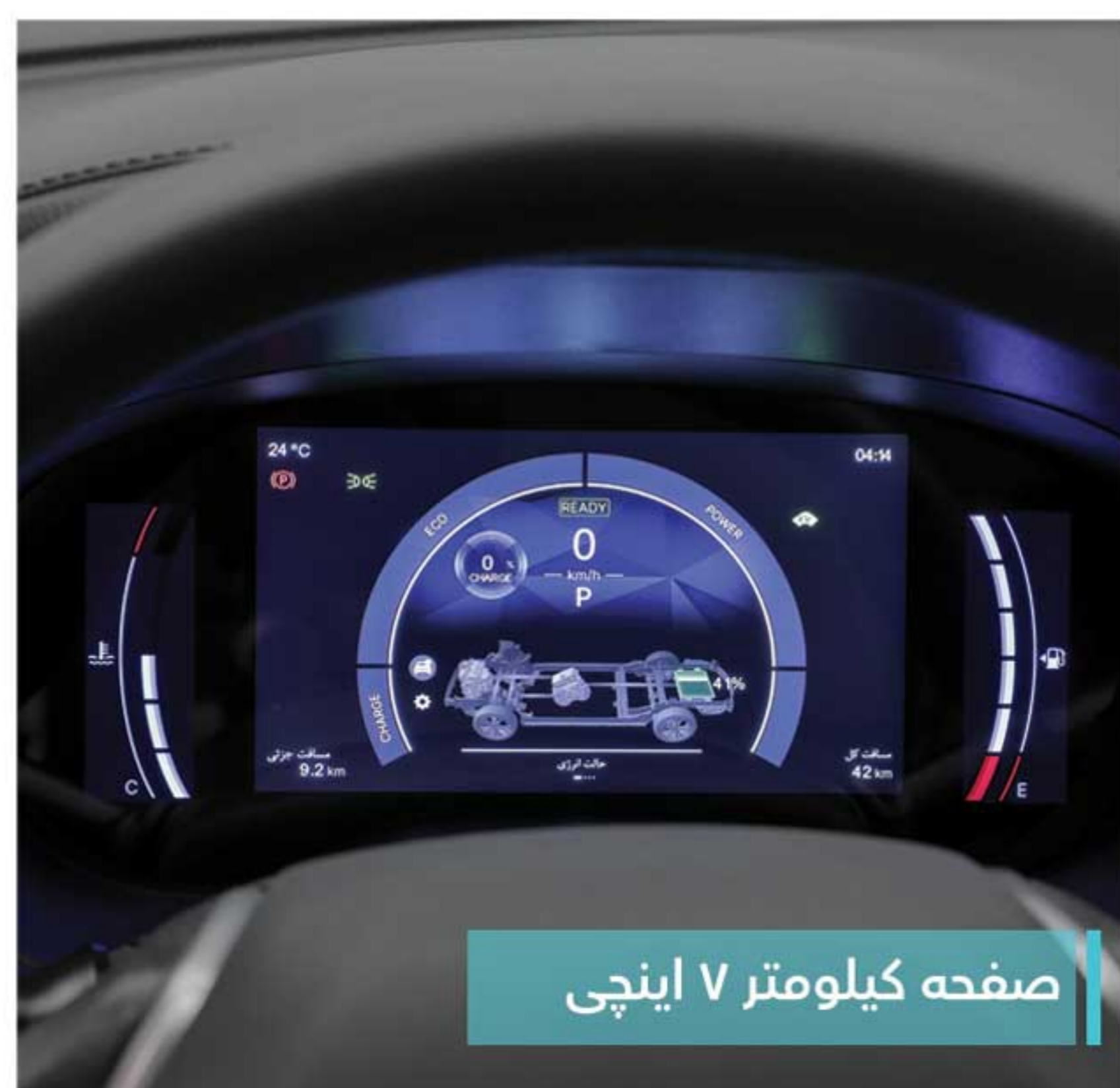
صفحه کیلومتر ۷ اینچی