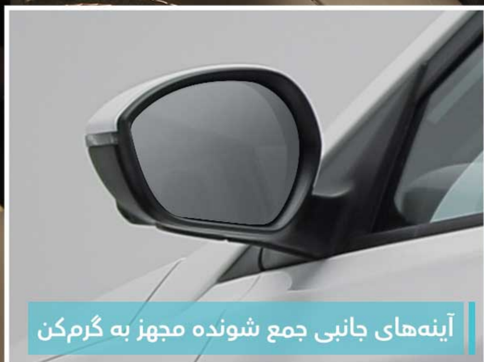
آینه‌های جانبی جمع شونده مجهز به گرمکن