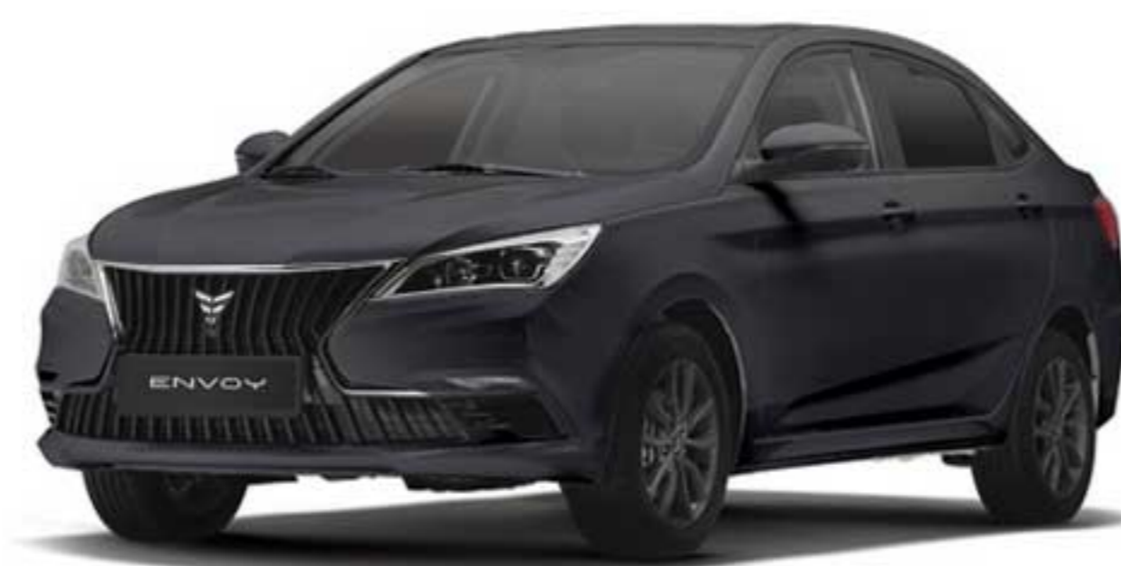
مشکی متالیک Black Metallic