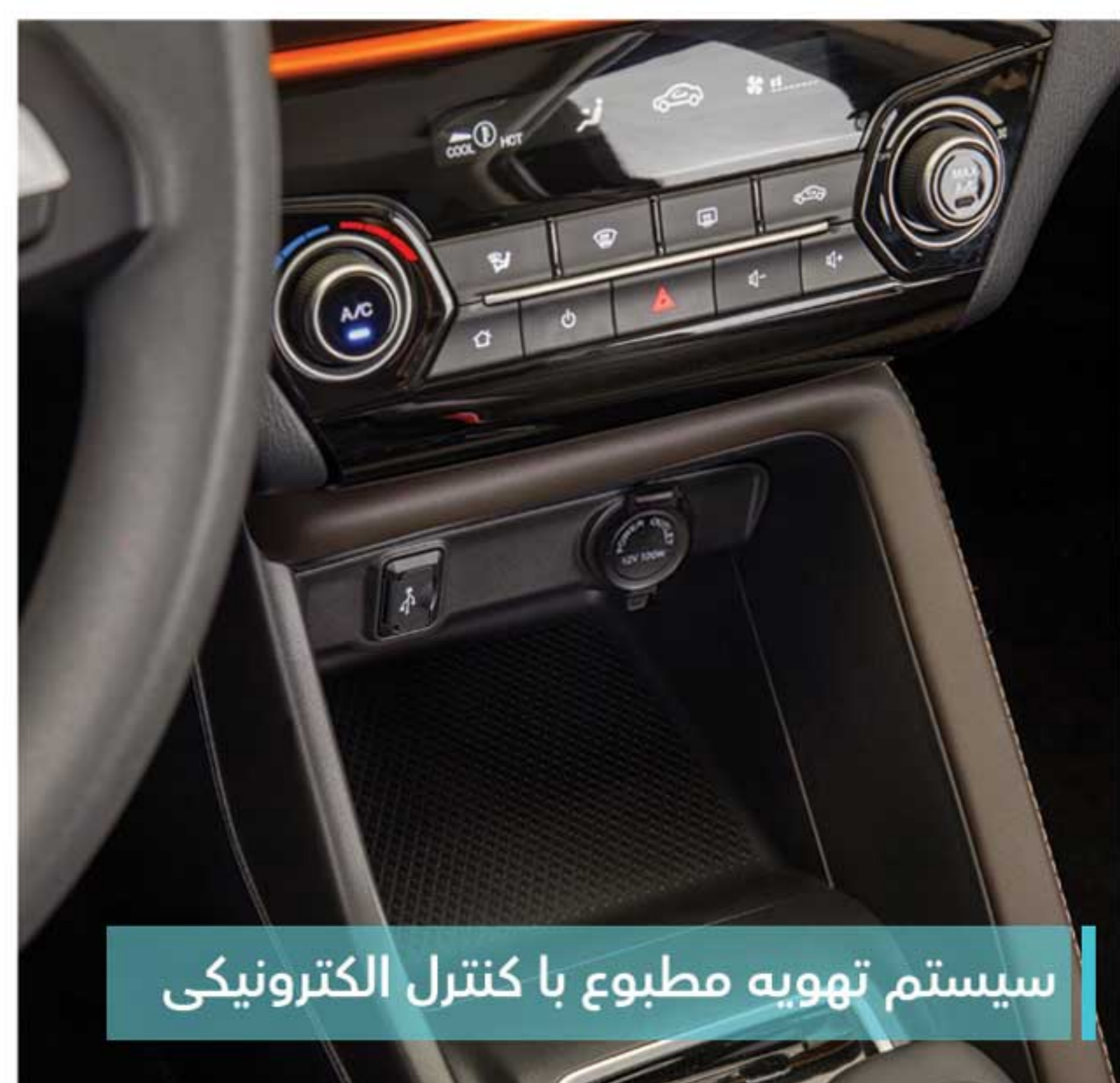
سیستم تهویه مطبوع با کنترل الکترونیکی