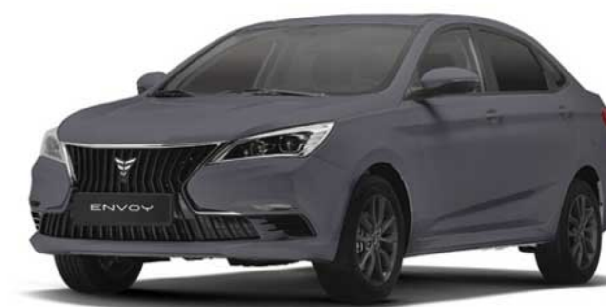
سربی متالیک Grey Metallic