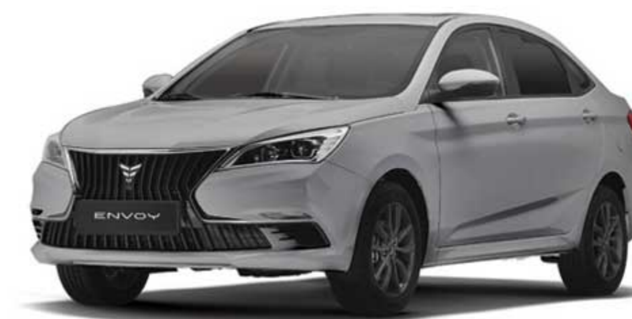
نقره‌ای متالیک Silver Metallic