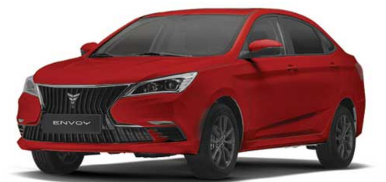
قرمز روناسی Ronas Red