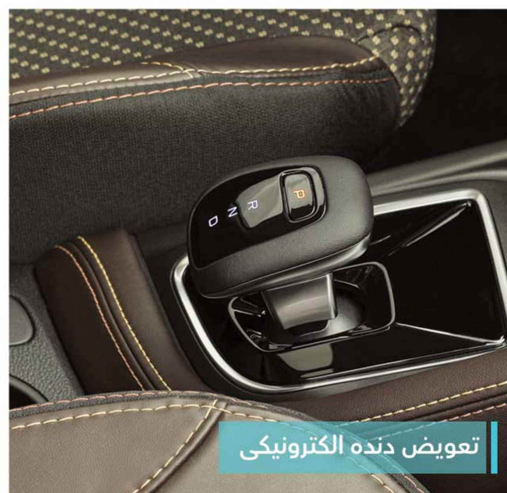
تعویض دنده الکترونیکی