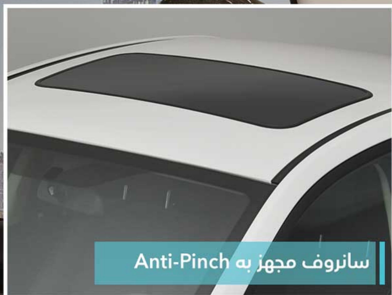
سانروف مجهز به Anti-Pinch