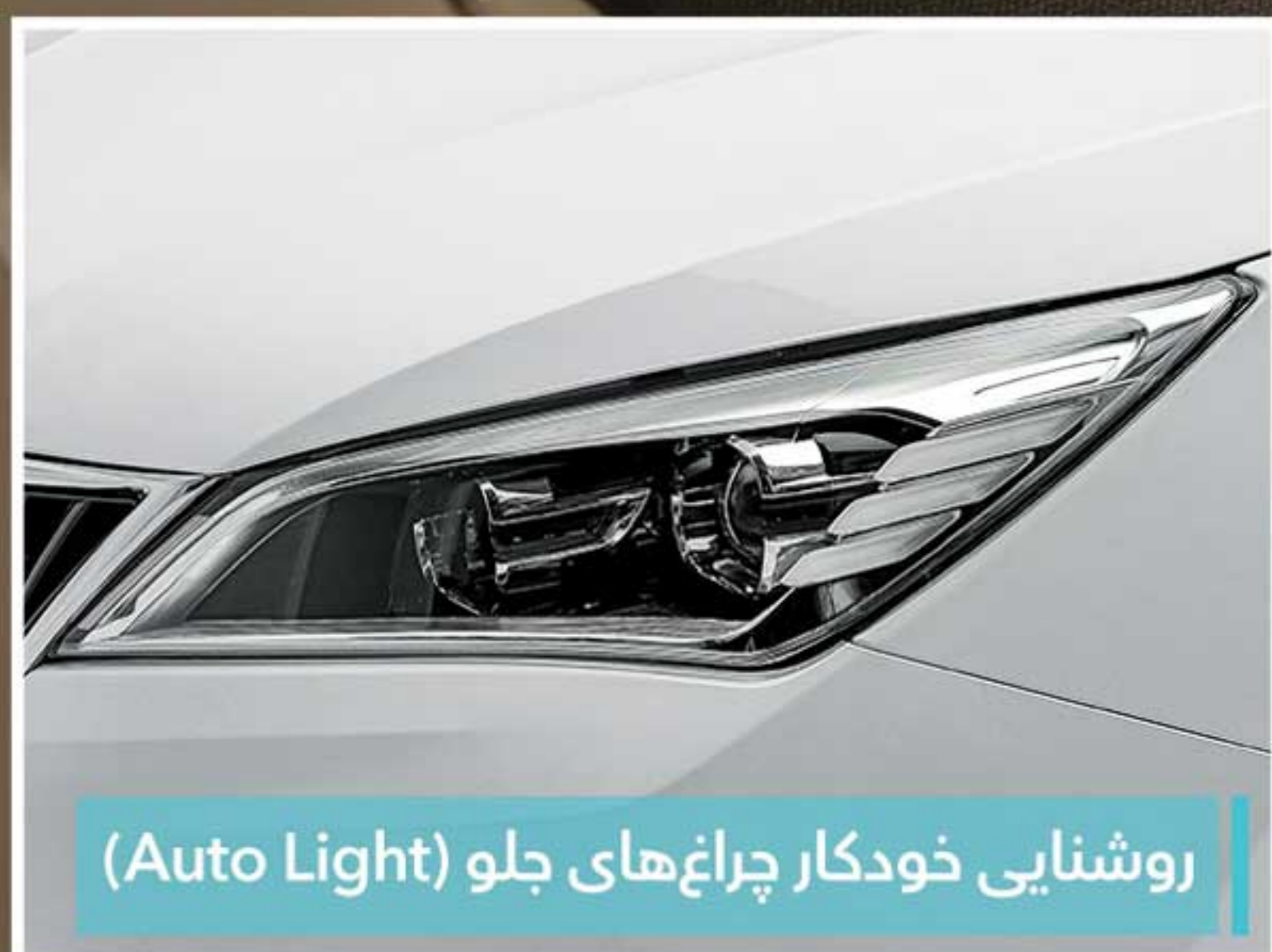
روشنایی خودکار چراغ‌های جلو (Auto Light)