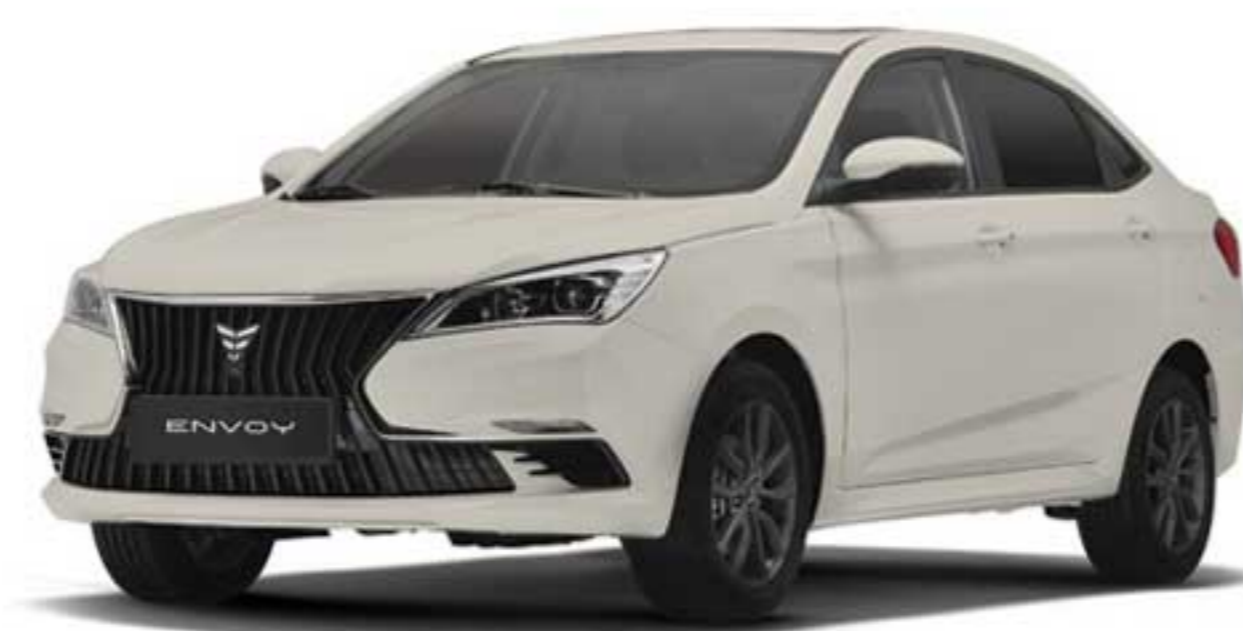
سفید صدفی Pearl White