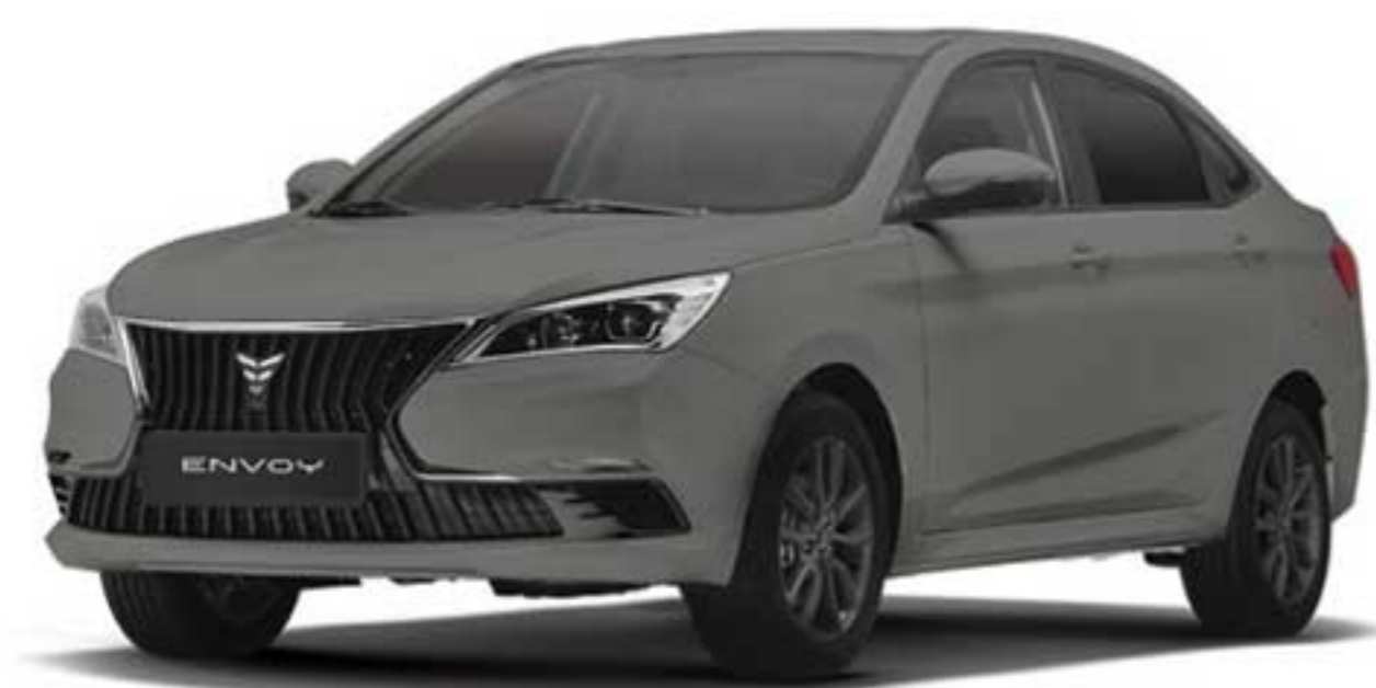
خاکستری کهکشانی Galaxy Grey