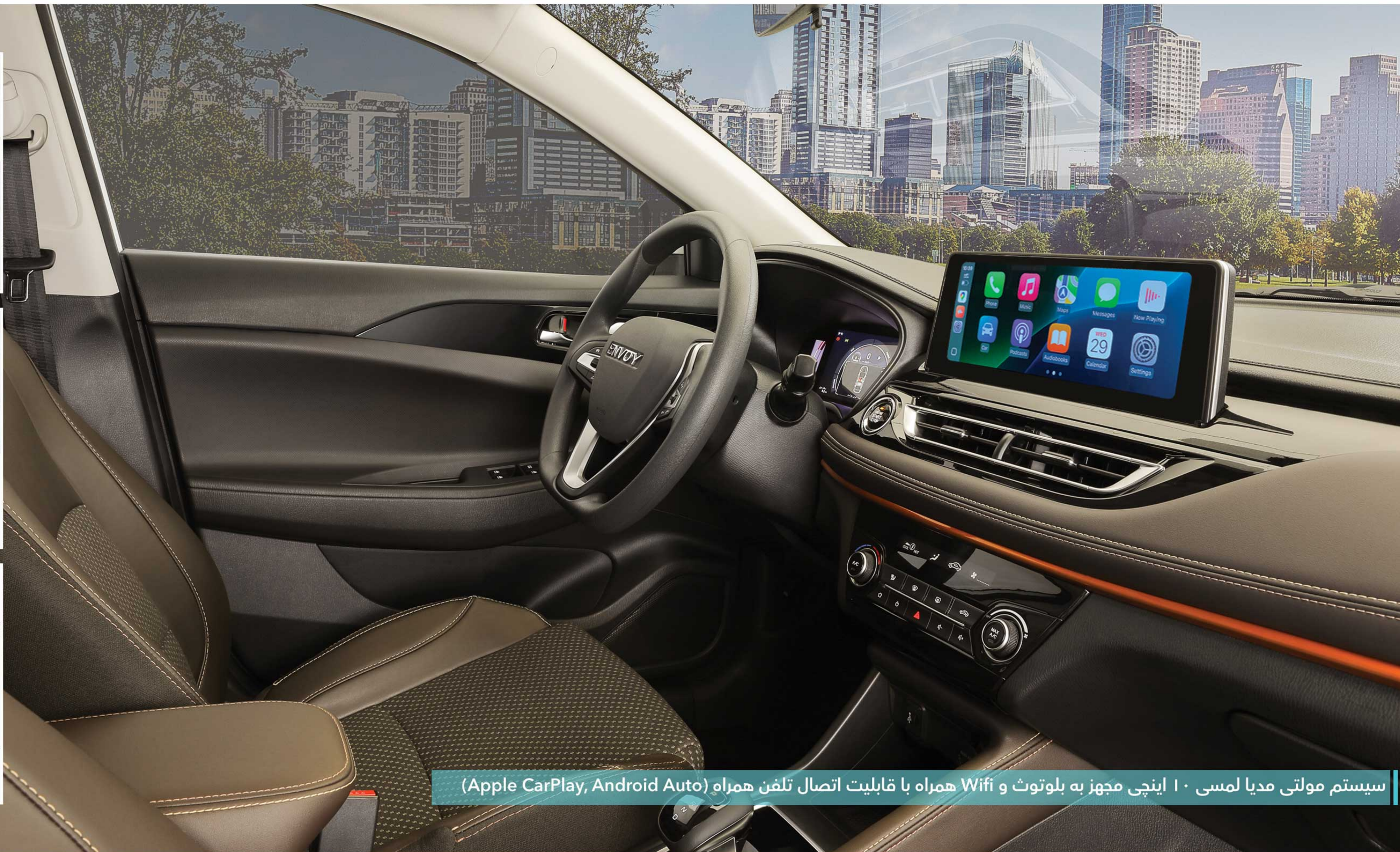
سیستم مولتی مدیا لمسی ۱۰ اینچی مجهز به بلوتوث و Wifi همراه با قابلیت اتصال تلفن همراه (Apple CarPlay, Android Auto)