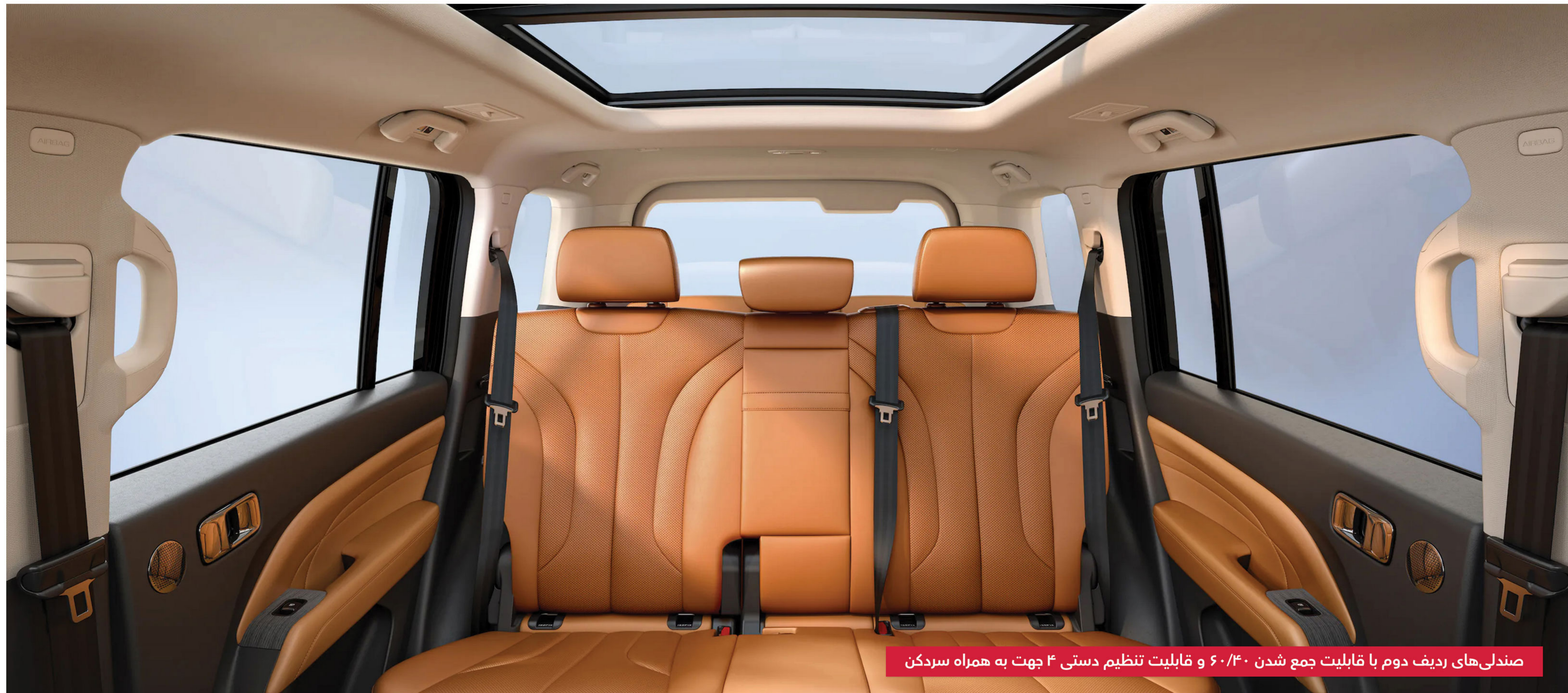
صندلی‌های ردیف دوم با قابلیت جمع شدن ۶۰/۴۰ و قابلیت تنظیم دستی ۴ جهت به همراه سردکن