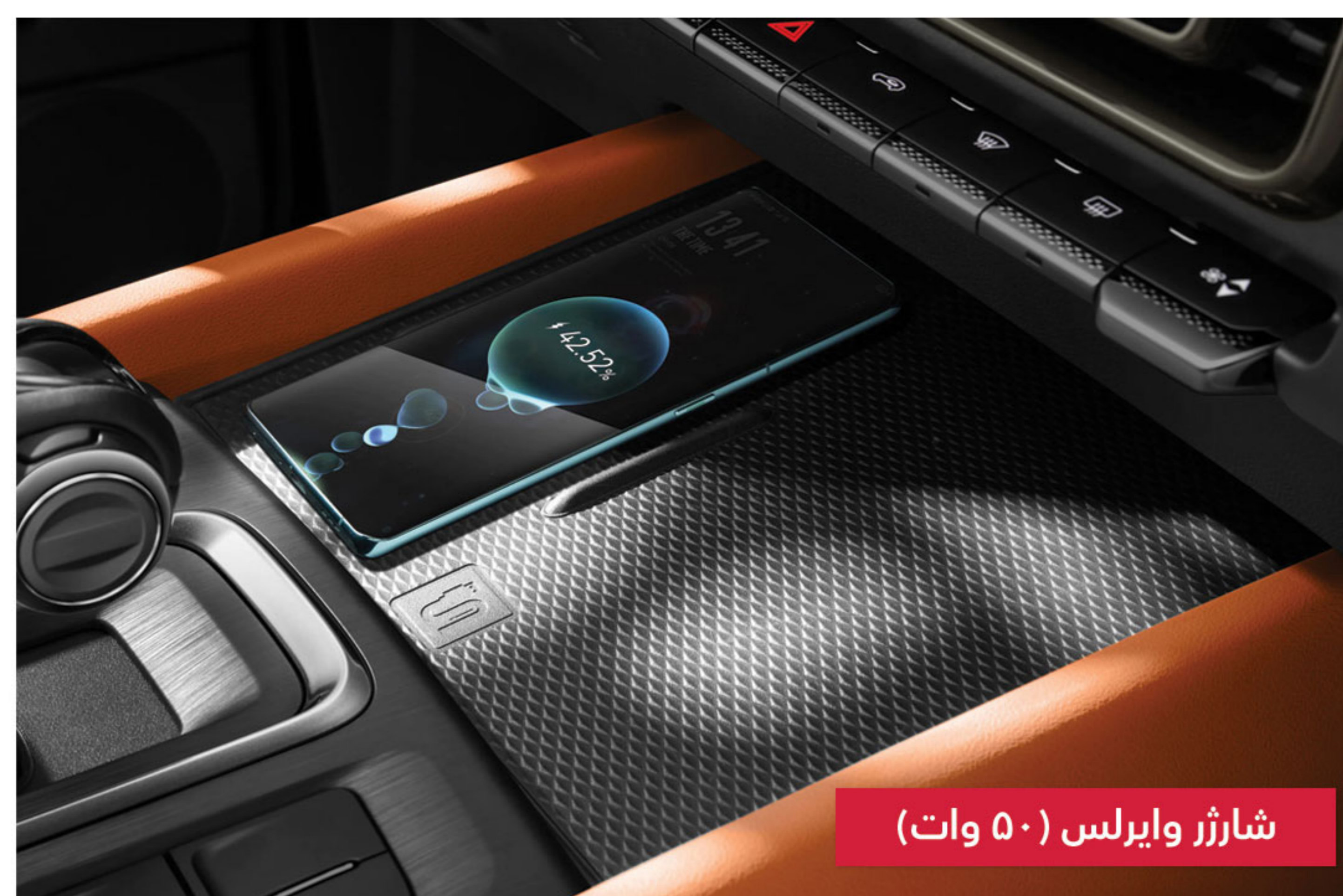
شارژر وایرلس (۵۰ وات)