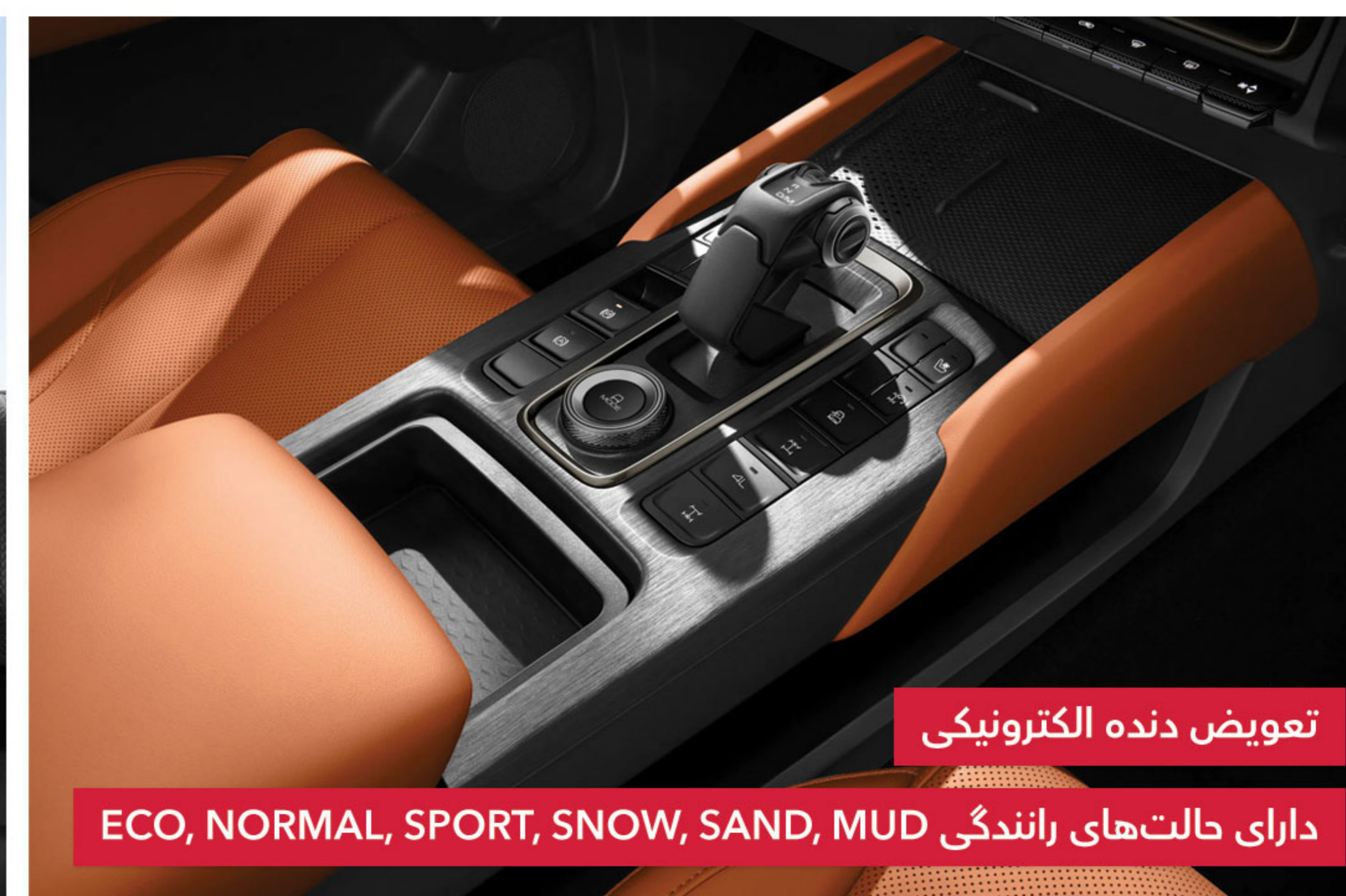
تعویض دنده الکترونیکی