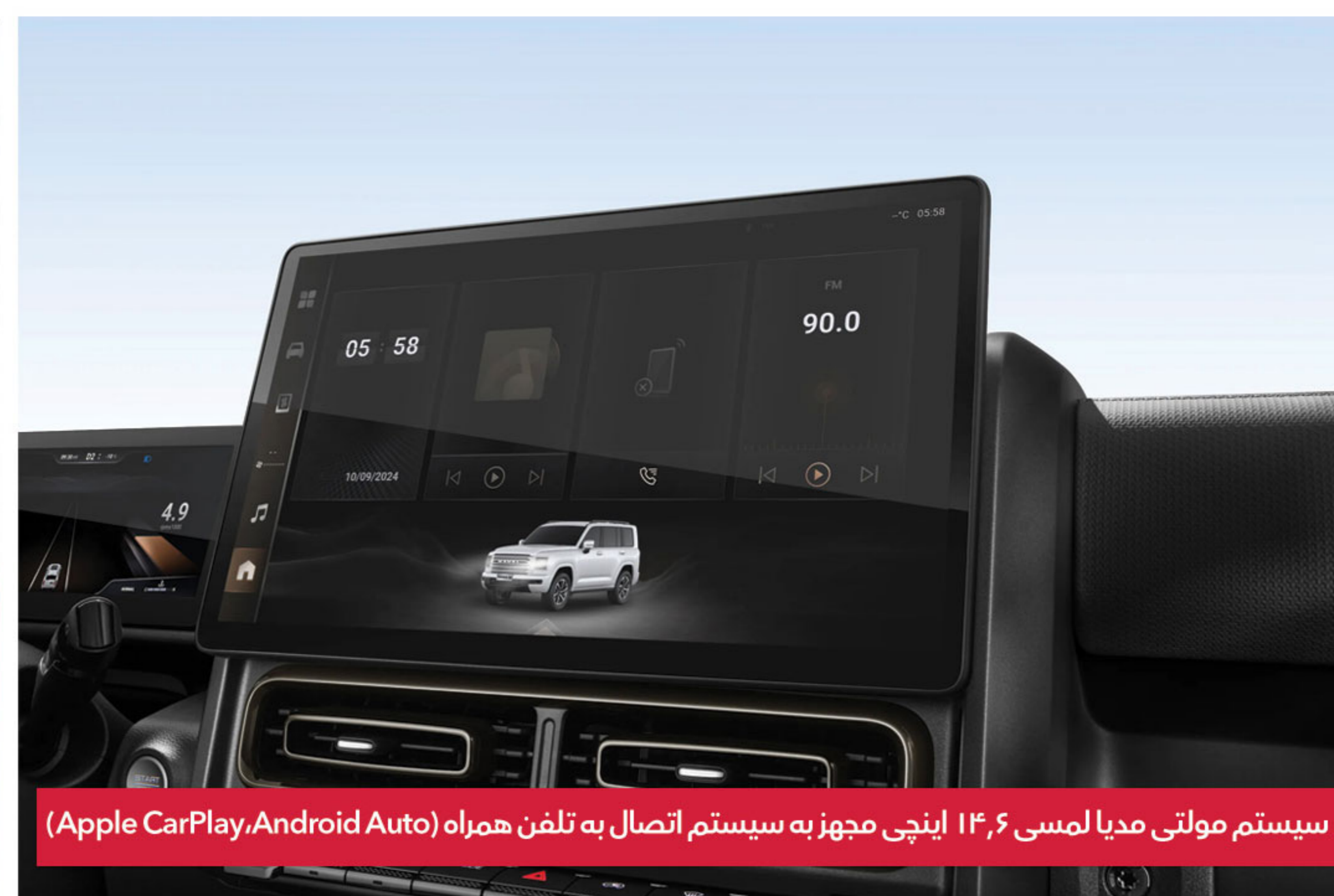
سیستم مولتی مدیا لمسی ۱۴٫۶ اینچی مجهز به سیستم اتصال به تلفن همراه (Apple CarPlay, Android Auto)